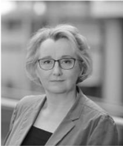
Theresia Bauer, Ministerin für Wissenschaft, Forschung und Kunst des Landes Baden-Württemberg: